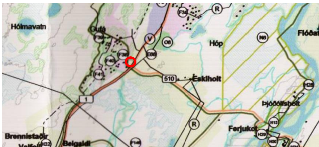
Mynd 3. Hluti gildandi Aðalskipulags sveitarfélagsins Borgarbyggðar 2010-2022, sem sýnir frístundasvæði (F37) í landi Eskiholts II. Rauði bringurinn táknað svæðið sem umræðir.

Samkvæmt gildandi aðalskipulagi sveitarfélagsins Borgarbyggðar 2010-2022 er gert ráð fyrir frístundasvæði 7 í Eskiholti II og það sýnt á aðalskipulagsupprætti (mynd 3).