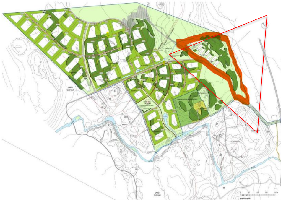
Mynd 1. Deiliskipulagsuppráttur Eskiholti II – Borgarbyggð, Skipulag frístundarbyggðar unnið af Landslagi 2021. Svæðið sem afmarkað er með rauðu sýnir hvar gistiðúsín eru staðsett.